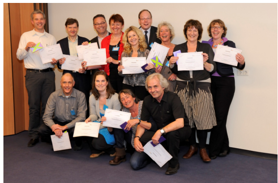
Het winnende team van Amsterdam Noord II

Een deskundige jury beoordeelde al deze ideeën, zij waren zeer verrast door de veelzijdigheid aan bedachte oplossingen voor bekende problemen bij kwetsbare ouderen.